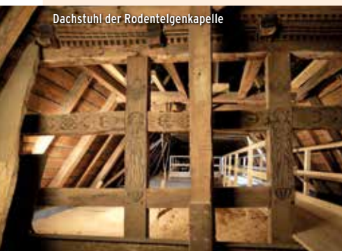
Dachstuhl der Rodentelgenkapelle