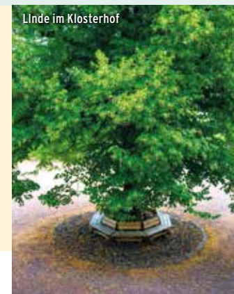
Linde im Klosterhof

↪ Linde im Klosterhof Oelinghausen (FKO)