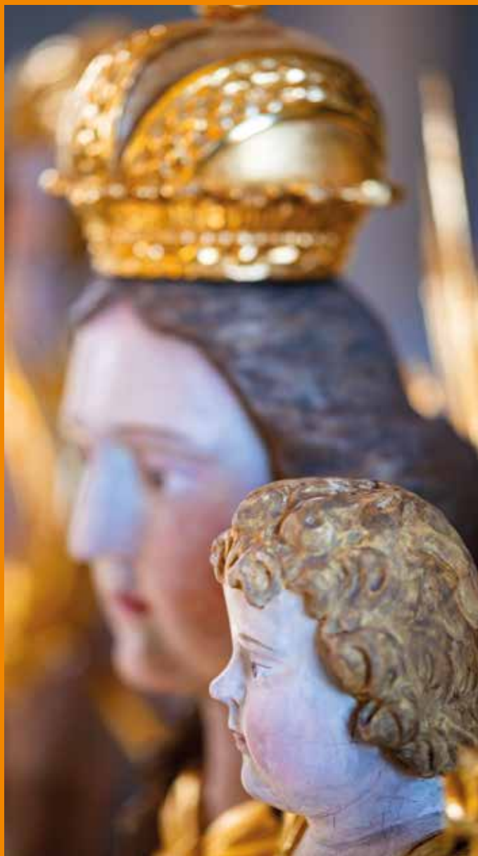
Detailansicht des Doppelkreuzes in der Klosterkirche Oelinghausen